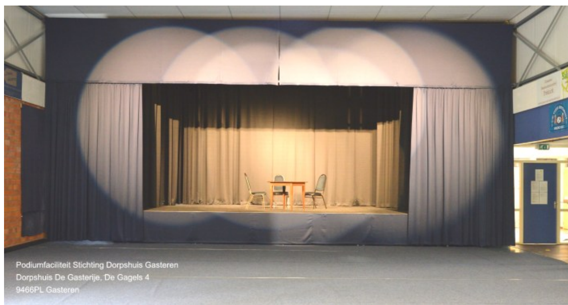
Podiumfaciliteit Stichting Dorpshuis Gasteren Dorpshuis De Gasterije, De Gagels 4 9466PL Gasteren

In deze editie van Neis oet 't Loeg onder andere de frisse start van Amicitia, de Rabo ClubSupport actie, de film Habitat, ruimte in het bos en minder maaien in het dorp, en terug- en vooruitblikken.