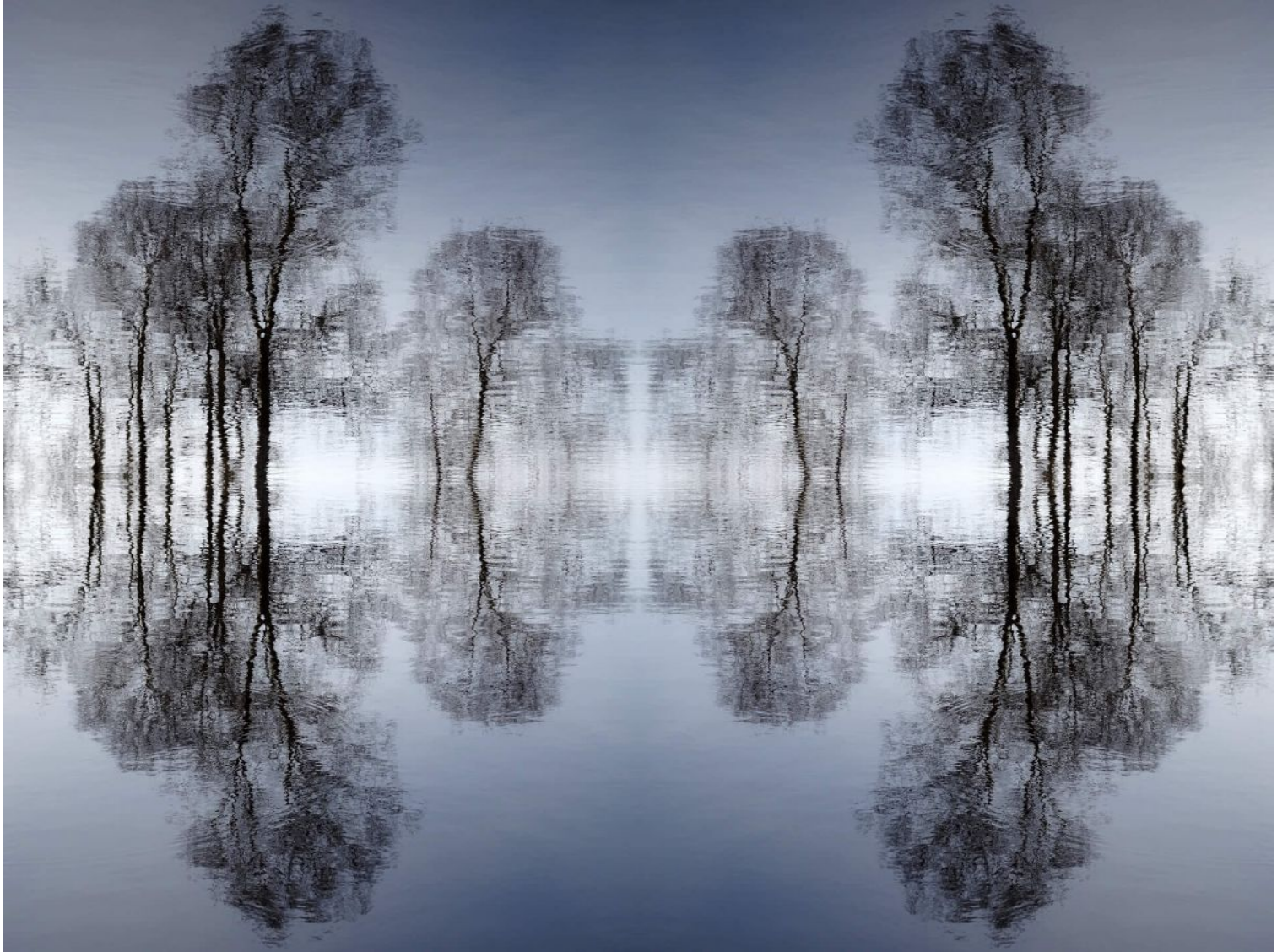
Serenity vierluik - IJsbahn Gasteren (c) Iris Koffijberg