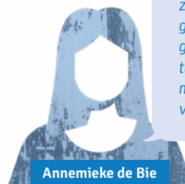
Annemieke de Bie

"Ik ben geen 'Extinction Rebellion type', maar ik vind wel dat we samen kunnen kijken hoe het duurzamer kan. Ik geloof dat het effectief kan zijn om kleinschalig aan de slag te gaan door bijvoorbeeld hier in het dorp te kijken hoe we het gebruik van olie en gas kunnen verminderen."